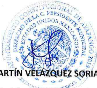
RENE MARTÍN VELÁZQUEZ SORIANO Presidente Municipal constitucional